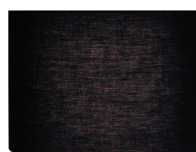
X002-W + S8095LE-W