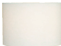
X002-W + S8095LE-V