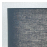
X001-(B-W) セード H350 Wφ500