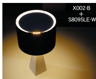
X002-B + S8095LE-W